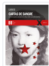
CARTAS DE SANGRE XI, LIAN