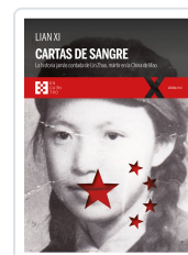
CARTAS DE SANGRE XI, LIAN