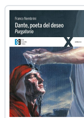
DANTE POETA DEL DESEO. PURGATORIO NEMBRINI, FRANCO