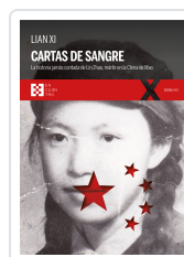
CARTAS DE SANGRE XI, LIAN