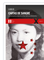
CARTAS DE SANGRE XI, LIAN