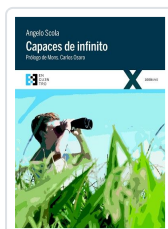
CAPACES DE INFINITO SCOLA, ANGELO