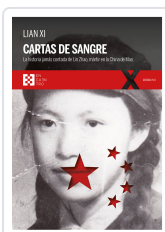
CARTAS DE SANGRE XI, LIAN