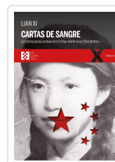
CARTAS DE SANGRE XI, LIAN