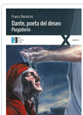
DANTE POETA DEL DESEO. PURGATORIO NEMBRINI, FRANCO