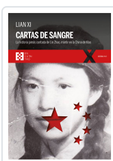
CARTAS DE SANGRE XI, LIAN