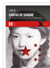
CARTAS DE SANGRE XI, LIAN