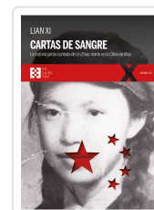
CARTAS DE SANGRE XI, LIAN