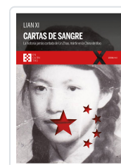
CARTAS DE SANGRE XI, LIAN