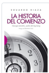
HISTORIA DEL COMIENZO RIAZA