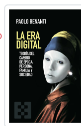
ERA DIGITAL, LA BENANTI, PAOLO