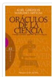
ORACULOS DE LA CIENCIA- CIENTIFICOS FAMOSOS CONTRA DIOS Y LA GIBERSON, KARL/ARTIGAS, MARIANO