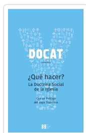
DOCAT +QUE HACER?