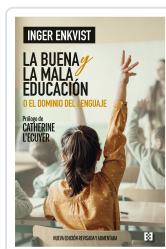
La buena y la mala educación Enkvist, Inger