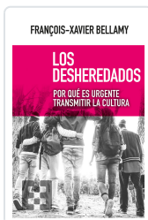
DESHEREDADOS, LOS BELLAMY, FRANÇOIS-XAVIER