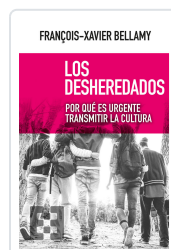
DESHEREDADOS, LOS BELLAMY, FRANÇOIS-XAVIER