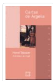
CARTAS DE ARGELIA TEISSIER, HENRI