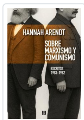
SOBRE MARXISMO Y COMUNISMO ARENDR, HANNAH