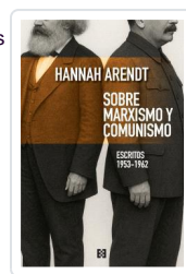
SOBRE MARXISMO Y COMUNISMO ARENDR, HANNAH