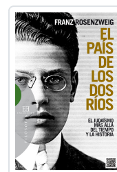
PAIS DE LOS DOS RIOS ROSENZWEIG, FRANZ