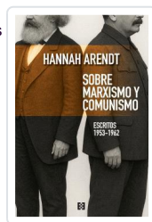
SOBRE MARXISMO Y COMUNISMO ARENDR, HANNAH