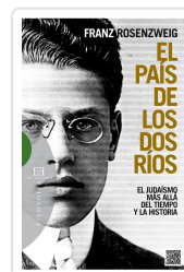
PAIS DE LOS DOS RIOS ROSENZWEIG, FRANZ