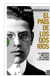
PAIS DE LOS DOS RIOS ROSENZWEIG, FRANZ