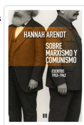
SOBRE MARXISMO Y COMUNISMO ARENDT, HANNAH