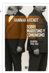
SOBRE MARXISMO Y COMUNISMO ARENDR, HANNAH