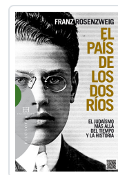
PAIS DE LOS DOS RIOS ROSENZWEIG, FRANZ