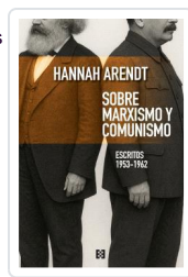
SOBRE MARXISMO Y COMUNISMO ARENDT, HANNAH