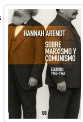
SOBRE MARXISMO Y COMUNISMO ARENDR, HANNAH