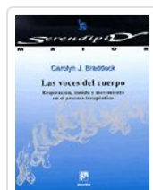
VOCES DEL CUERPO, LAS BRADDOCK