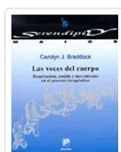
VOCES DEL CUERPO, LAS BRADDOCK