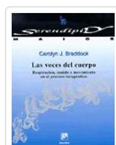
VOCES DEL CUERPO, LAS BRADDOCK