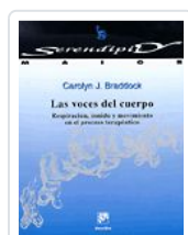
VOCES DEL CUERPO, LAS BRADDOCK