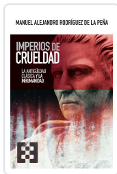
IMPERIOS DE CRUELDAD RODRIGUEZ DE LA PEÑA, M.ALEJANDRO