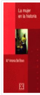
MUJER EN LA Hª, LA BEL BRAVO