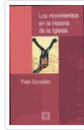
MOVIMIENTOS EN LA Hª DE LA IGLESIA GONZALEZ, FIDEL