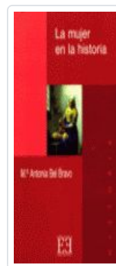
MUJER EN LA Hª, LA BEL BRAVO