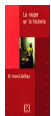
MUJER EN LA Hª, LA BEL BRAVO