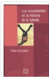
MOVIMIENTOS EN LA Hª DE LA IGLESIA GONZALEZ, FIDEL