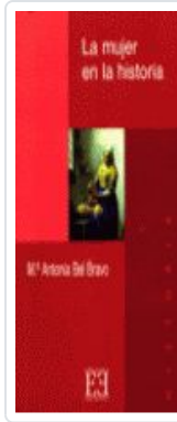
MUJER EN LA Hª, LA BEL BRAVO