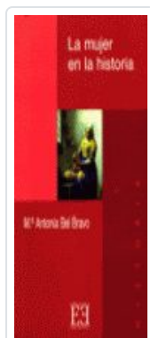
MUJER EN LA Hª, LA BEL BRAVO