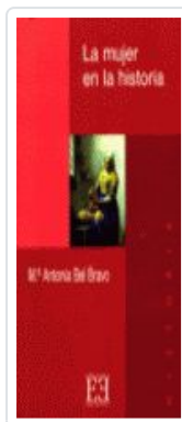
MUJER EN LA Hª, LA BEL BRAVO