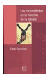
MOVIMIENTOS EN LA Hª DE LA IGLESIA GONZALEZ, FIDEL