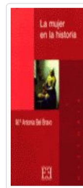
MUJER EN LA Hª, LA BEL BRAVO