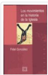
MOVIMIENTOS EN LA Hª DE LA IGLESIA GONZALEZ, FIDEL