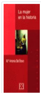
MUJER EN LA Hª, LA BEL BRAVO