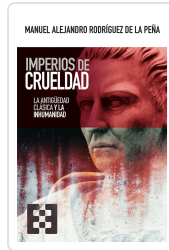
IMPERIOS DE CRUELDAD RODRIGUEZ DE LA PEÑA, M.ALEJANDRO