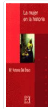
MUJER EN LA Hª, LA BEL BRAVO