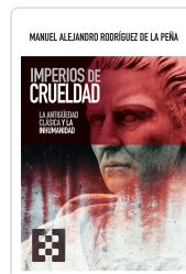
IMPERIOS DE CRUELDAD RODRIGUEZ DE LA PEÑA, M.ALEJANDRO