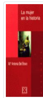
MUJER EN LA Hª, LA BEL BRAVO