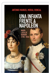
Una infanta frente a Napoleón Antonio Manuel Moral Roncal