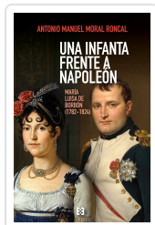
Una infanta frente a Napoleón Antonio Manuel Moral Roncal