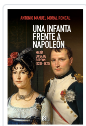
Una infanta frente a Napoleón Antonio Manuel Moral Roncal