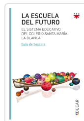
ESCUELA DEL FUTURO DE LEZAMA, LUIS