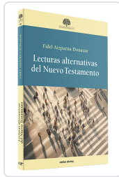
Lecturas alternativas del Nuevo Testamento Aizpurúa Donazar, Fidel