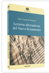
Lecturas alternativas del Nuevo Testamento Aizpurúa Donazar, Fidel