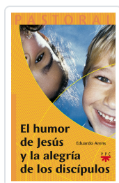
HUMOR DE JESUS Y LA ALEGRÍA DE LOS DISCÍPULOS ARENS