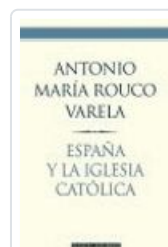
ESPAÑA Y LA IGLESIA CATOLICA ROUCO VARELA, ANTONIO MARIA