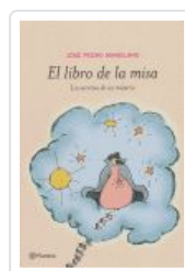
LIBRO DE LA MISA, EL MANGLANO