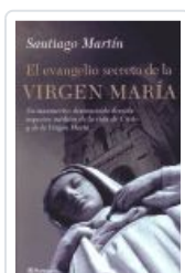
EVANGELIO SECRETO (GRANDE PANETA) VIRGEN MARIA MARTIN, SANTIAGO