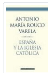
ESPAÑA Y LA IGLESIA CATOLICA ROUCO VARELA, ANTONIO MARIA