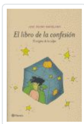
LIBRO DE LA CONFESION MANGANO