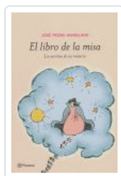
LIBRO DE LA MISA, EL MANGANO