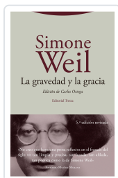
La gravedad y la gracia Weil, Simone