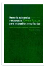
MEMORIA SUBERSIVA Y ESPERANZA PARA LOS PUEBLOS CRUCIFICADOS ALEGRE, XAVIER