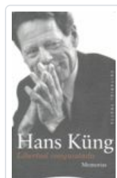
LIBERTAD CONQUISTADA. MEMORIAS HANS KUNG KUNG, HANS