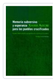
MEMORIA SUBERSIVA Y ESPERANZA PARA LOS PUEBLOS CRUCIFICADOS ALEGRE, XAVIER