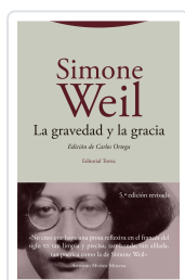
La gravedad y la gracia Weil, Simone