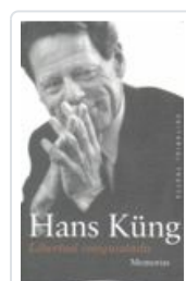
LIBERTAD CONQUISTADA. MEMORIAS HANS KUNG KUNG, HANS