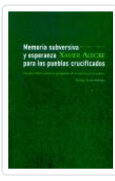
MEMORIA SUBERSIVA Y ESPERANZA PARA LOS PUEBLOS CRUCIFICADOS ALEGRE, XAVIER