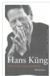
LIBERTAD CONQUISTADA. MEMORIAS HANS KUNG KUNG, HANS