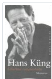
LIBERTAD CONQUISTADA. MEMORIAS HANS KÜNG KÜNG, HANS