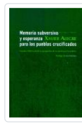
MEMORIA SUBERSIVA Y ESPERANZA PARA LOS PUEBLOS CRUCIFICADOS ALEGRE, XAVIER