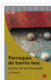
PARROQUIA DE BARRIO HOY BRIONES, LUIS