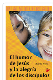
HUMOR DE JESÚS Y LA ALEGRIA DE LOS DISCÍPULOS ARENS