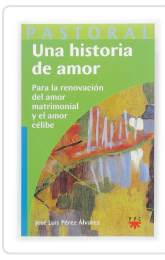
UNA Hª DE AMOR. PARA LA RENOVACION DEL AMOR PEREZ ALVAREZ, J.L.