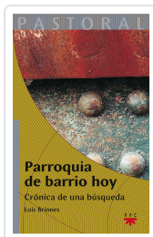
PARROQUIA DE BARRIO HOY BRIONES, LUIS