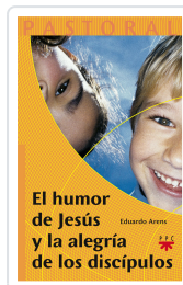
HUMOR DE JESUS Y LA ALEGRÍA DE LOS DISCÍPULOS ARENS