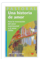
UNA Hª DE AMOR. PARA LA RENOVACION DEL AMOR PEREZ ALVAREZ, J.L.