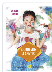
JUGUEMOS A SENTIR! BAYOD SERAFINI